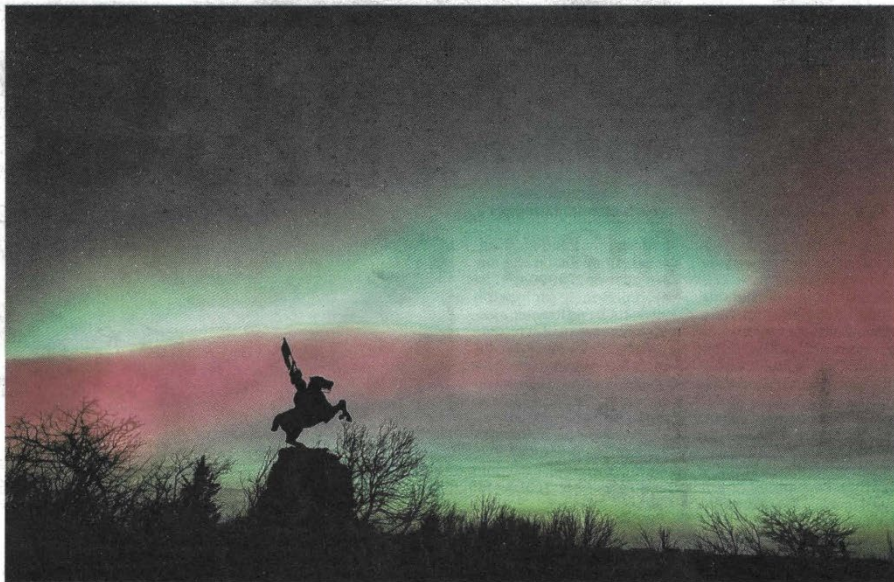
La Jeanne d'Arc se détache au milieu de la nuit sur le fond de rouge et vert flamboyants.

« Entre 22 h et 23 h, le ciel s'est coloré en rouge avec des leurs vertes qui bougeaient comme des grosses vagues. J'ai pris des clichés au niveau de la Jeanne d'Arc et j'ai bougé pour en faire aussi avec la Vierge du sommet. J'avais déjà vu des aurores en novembre 2025 et le 11 juin 2024 au Ballon. C'est donc assez courant, mais là, le phénomène a duré jusqu'à